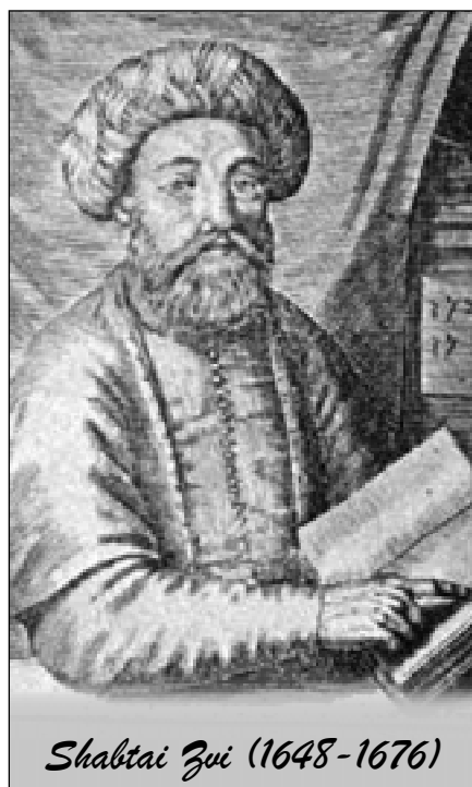
Shabtai Zvi (1648-1676)

Reprezentanții comunităților evreiești din Viena și Florența, au înaintat Înalțului Comisariat pentru Refugiați un proiect de emigrare a unui număr mare de evrei din Germania și de stabilire a lor în Albania. Proiectul costa opt milioane de franci de aur, sub formă de investiții în văile fluviilor Buna și Drin, în nord-vestul Albaniei. Acest proiect a fost adus la cunoștința Ministerului Afacerilor Externe al Albaniei din acea vreme, însoțit de o sugestie scrisă a ambasadorului albanez de la Liga Națiunilor. Statul albanez își exprima oficial dorința ca un număr de evrei să se stabilească și în zona Muzeqea. Dar Regatul Albaniei n-a putut realiza acest proiect din cauza presiunilor Italiei mussoliniene.