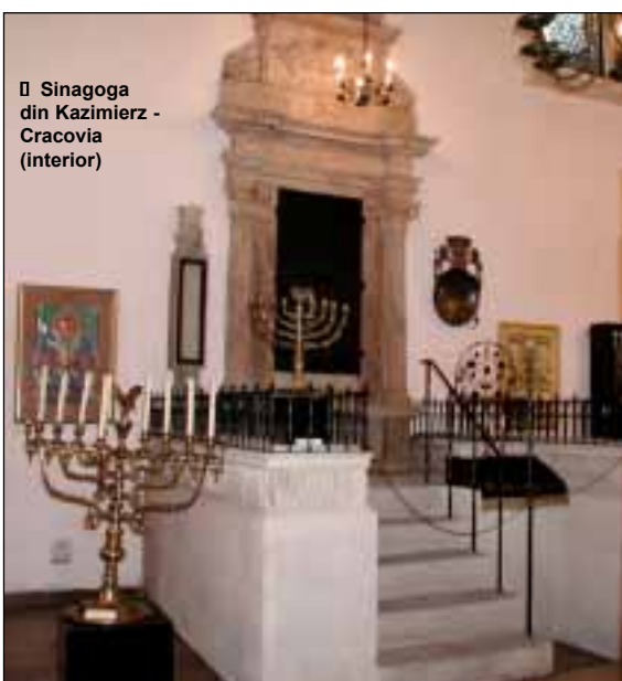
□ Sinagoga din Kazimierz - Cracovia (interior)