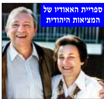
ספריית האודיו של המציאות היהודית