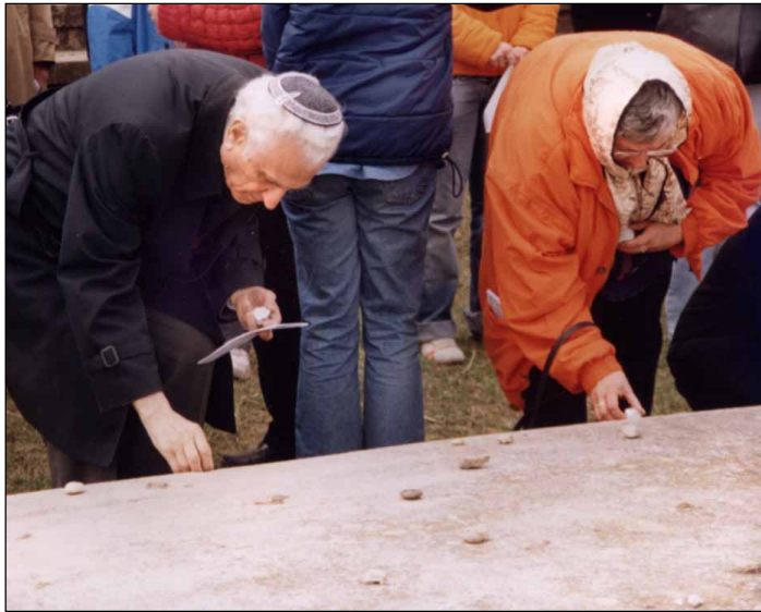
המשתתפים מהאזור המחישו לצעירים את תופעת השואה. מטרתו של האירוע, כמו בשנה שעברה, היתה העברת הזכרונות על התופעות הטרגיות מדור לדור, כיון שהשכיחה במקרה הזה היא הרשעה חוזרת למוות.