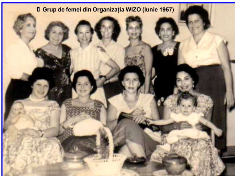
Grup de femei din Organizația WIZO (iunie 1957)

În perioada 1945-1949, multe organizații WIZO din diferite țări îi pregătesc pe tineri pentru plecarea în Eretz Israel. În 1949, WIZO participă la primele alegeri pentru Knesset, iar Rachel Kagan este aleasă deputat. În același an, sediul organizației se mută la Tel Aviv. Ea își intensifică activitatea sprijinind femeile emigrante. În 1959, WIZO este recunoscută în cadrul O.N.U. ca organizație neguvernamentală, apoi în UNICEF. În 1962, se deschide primul Club WIZO pentru femeile arabe din Israel, iar organizația decide drept activitate prioritară absorbția socială a noilor emigranți. În 1965, la cel de-al 26-lea Congres Mondial Sionist, 12 femei din WIZO primesc drept de vot și un loc în Comitetul Executiv. În 1969, organizația se implică direct în activități în favoarea evreilor sovietici, pregătind voluntari și infrastructură pentru absorbția lor. În