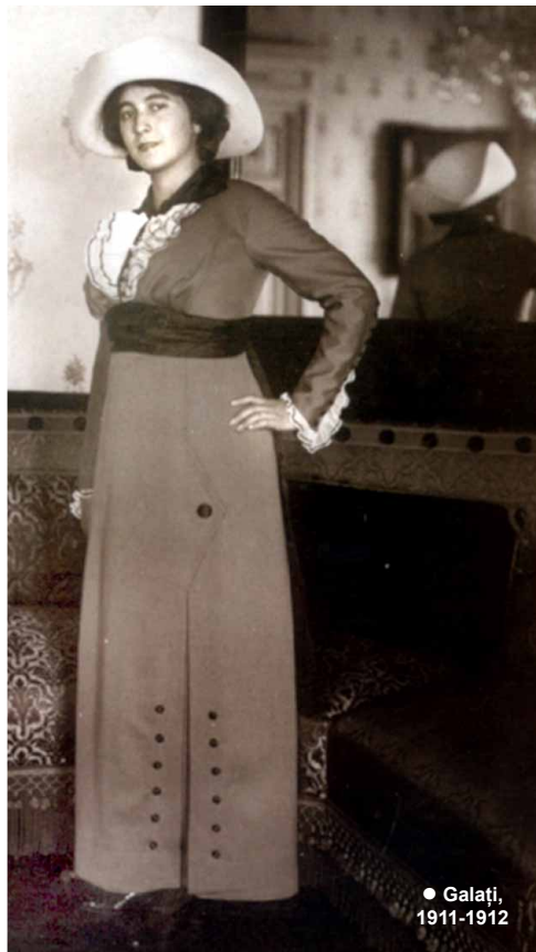
● Galați, 1911-1912