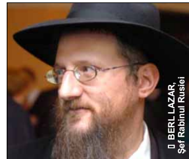
BERL LAZAR, Șef Rabinul Rusiei

În februarie, 12 partide politice importante din Rusia au semnat un „pact antifascist” împotriva naționalismului, xenofobiei și urii interreligioase. Acordul afirmă că astfel de activități sunt interzise de lege în Rusia, dar ele trebuie condamnate și moral. Dar alte 25 de partide au refuzat să semneze pactul, afirmând că „nu vor să participe la o astfel de acțiune de propagandă publică”.