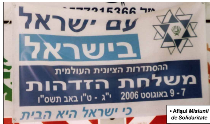
• Afișul Misiunii de Solidaritate