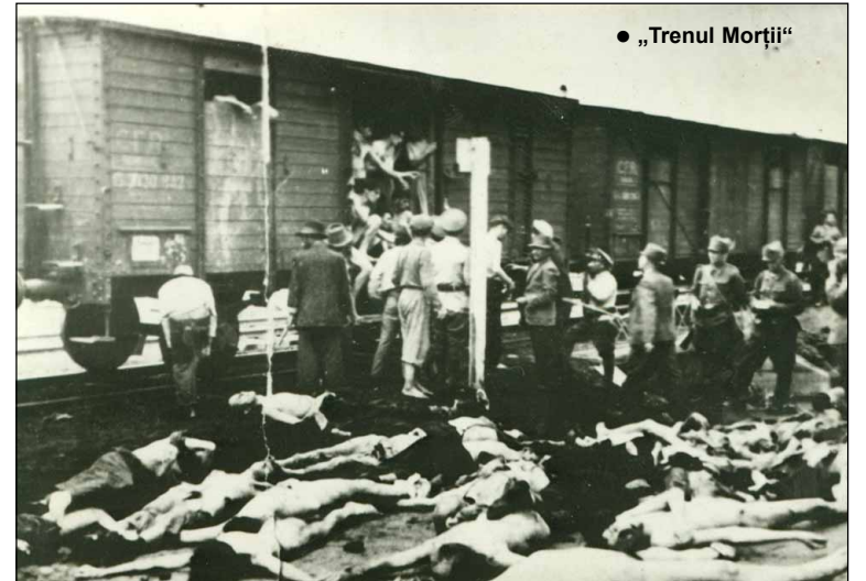
• „Trenul Morții”

Paralel cu fabricarea dovezilor despre aviatori și parașutiști sovietici care sunt ajutați de iudeo-comuniști și paralel cu „psihoza semnalizărilor”, care și ea a fost rezultatul inițiativei planificatorilor pogromului, la 27 iunie 1941 comandantul militar al orașului, colonelul Lupu, a primit ordin să pregătească evacuarea tuturor celor circa 50.000 de evrei ai Iașului în lagărul de la Târgu-Jiu, ordin imposibil de executat într-un timp scurt, în vremuri normale, cu atât mai mult într-o perioadă de operațiuni militare.