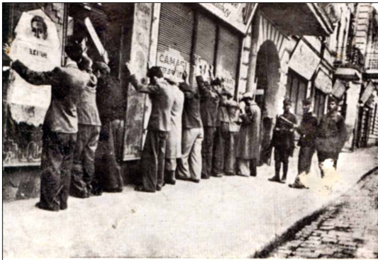
Pe strada I. C. Brătianu, în dreptul casei cu No. 157, grup de evrei ținându-și la zid, cu mâinile ridicate, păziți de soldați, dintre cari unul în haine civile, dar cu boneta militară.