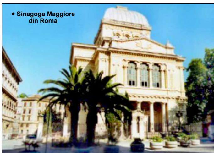
• Sinagoga Maggiore din Roma