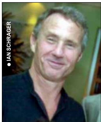
• IAN SCHRAGER

În New York, „Studio 54“ a fost un loc - și un local de noapte - de adunare a elitei politice și artistice a megalopolisului (atmosfera exclusivă de acolo generând și subiectul unui film artistic). Conceput de Philippe Stark, el a devenit un loc de legendă al vieții de noapte newyorkeze. Nu departe de el, André Putnam a desenat interiorul Hotelului Morgan, iar în Florida, la Miami, din nou Stark a transformat un hotel retro, „Delano“, într-un loc de atracție pentru lumea bogată și celebră a Coastei de Est. Dar „Studio 54“, „Morgan“ și „Delano“, ca și alte hoteluri și localuri celebre, au fost renovate și transformate la inițiativa lui Ian Schrager, unul dintre promotorii inovatori ai Americii. E interesant că Ian Schrager, a cerut delibet designerilor interioare originale, cu un anumit disconfort estetic, desigur, nefuncțional, care au atras amatorii de decor neobișnuit, de cadrul unic și chic. Dar un om original rămâne original până la capăt. Astfel