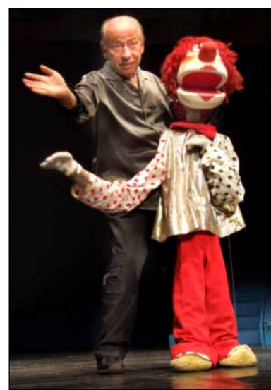
● „Romanul unui om de afaceri” (T.E.S.)

● Rădulescu Zola și păpușile lui . După ce a încântat generații de copii și tineri în România și, apoi, în Israel, Rădulescu Zola a demonstrat la Sibiu că talentul și charisma nu au vârstă. Publicul, format din maturi și foarte puțini copii, a intrat în jocul propus de cunoscutul marionetist. Foarte emoționat, după o lungă despărțire de publicul românesc, Zola a mulțumit pentru căldura unui public care l-a întâmpinat cu minute bune de aplauze.