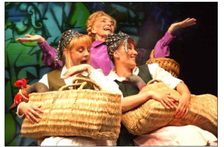
● „Romanul unui om de afaceri” (T.E.S.)