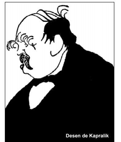
Desen de Kapralik