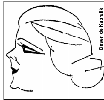
Desen de Kapralik

Elvira Popescu are o frumusețe de scenă. Este o acțiune în armonia înfățișării ei, este un element dramatic și viu în acest trup. Decorează o situație, mobilizează un spațiu, valorifică o