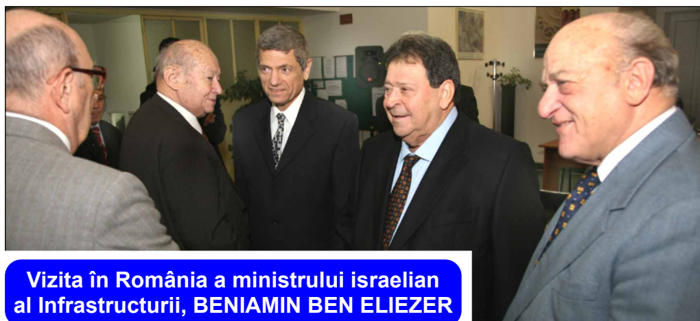
Vizita în România a ministrului israelian al Infrastructurii, BENIAMIN BEN ELIEZER