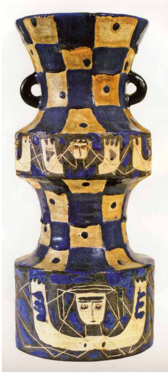
1. Ceramică (Vasul himerelor, 1930)